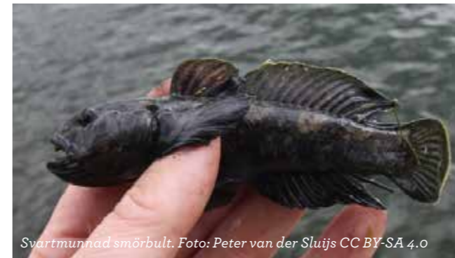
Svartmunnad smörbult.

Solabborre påträffades för första gången i Sverige 2012 i sjön Åsnen i Småland. Den har tidigare spridits till stor del genom handel med arten, men den kan också rymma och förvildas. Det finns risk att arten etablerar sig i Sverige. Solabborren är färgglad och dess kropp är hög i förhållande till längden. Den blir omkring tio centimeter lång, men kan bli betydligt längre i sitt naturliga utbredningsområde. Solabborren kan sprida fiskparasiter till våra inhemska arter och denna snäckätande fisk kan även påverka undervattensväxterna negativt.