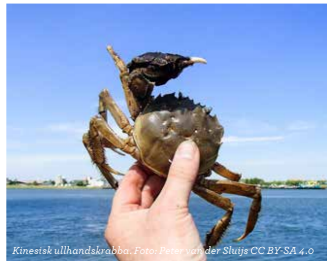
Kinesisk ullhandskrabba.

Ullhandskrabban sprids oavsiktligt och kontinuerligt med fartygens barlastvatten. Första fyndet i Sverige gjordes på 1930-talet. Krabban har stor förmåga att anpassa sig till olika miljöer. Den lever i sötvatten men arten behöver saltvatten för att föröka sig. Den vuxna ullhandskrabban har ulliga klor och ryggskölden är rundad, max 10 centimeter bred, med ett v-format jack mellan ögonen. Krabban kan sprida sjukdomar och parasiter. Där ullhandskrabban finns kan också strandkanter och flodbänkar undermineras då den gräver och bygger gångar. Den kan även orsaka skada för fiske och vattenbruk genom att förstöra redskap och ta fångsten.