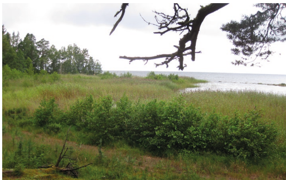
Fagersand norra Brommö 2000 och 2012.