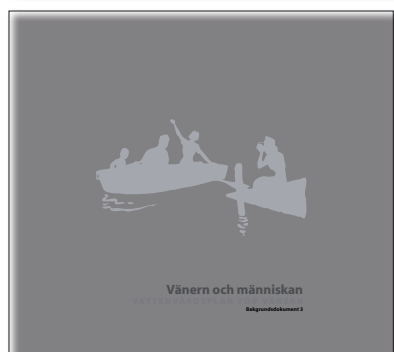
De tre bakgrundsdocumenten som antogs 2006.