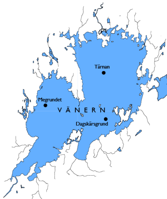
Figur 1. Övervakningsstationer för djurplankton, där också vattenkvaliteten undersöks. Djurplanktonprov tas från 0-10, 10-20 och 20-40 meter i mitten av juni och augusti varje år (Dagskärsgrund max 20 m).

The zooplankton population is quite constant over time in Lake Vänern, with some variability within and between years. The development is mainly driven by the phytoplankton primary production that in its turn is driven by the prevailing weather conditions as well as the nutrient availability. In 2017 the development was characterised by larger abundances and biovolumes in June. Most abundant were rotatorians and copepods. In August the abundances were on a more normal level, while the biovolumes were considerably lower than normal. The low biovolumes were mainly due to comparatively few cladocerans that normally make up a considerable part of the biovolumes in late summer.