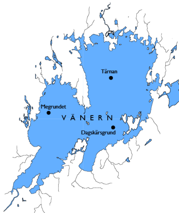
Figur 1. Övervakningsstationer för djurplankton, där också vattenkvaliteten undersöks. Djurplanktonprov tas från 0-10, 10-20 och 20-40 meter i mitten av juni och augusti varje år (Dagskärsgrund max 20 m).

The zooplankton population is quite constant over time in Lake Vänern, with some variability within and between years. The development is mainly driven by the phytoplankton primary production that in its turn is driven by the prevailing weather conditions as well as the nutrient availability. In 2017 the development was characterised by larger abundances and biovolumes in June. Most abundant were rotatorians and copepods. In August the abundances were on a more normal level, while the biovolumes were considerably lower than normal. The low biovolumes were mainly due to comparatively few cladocerans that normally make up a considerable part of the biovolumes in late summer.